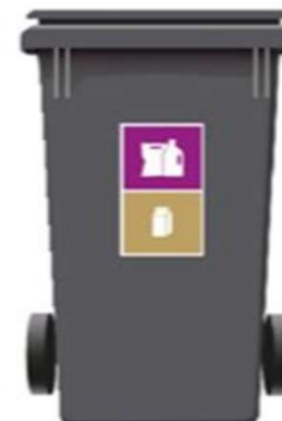
240 L 1-rum