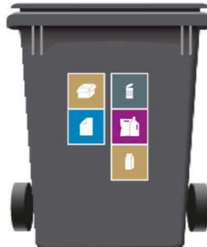
370 L 2-rum