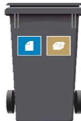
240 L 2-rum