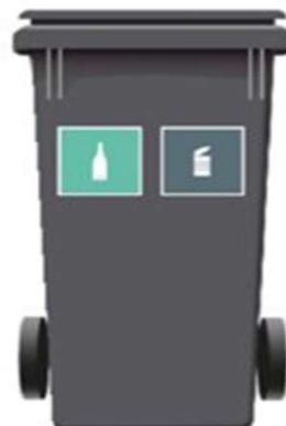
240 L 2-rum