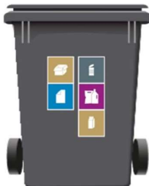
370 L 2-rum